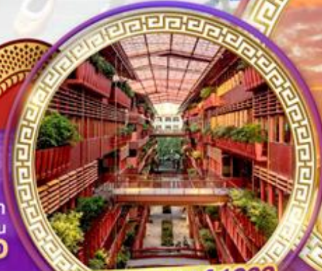
The street of 1000 red jars