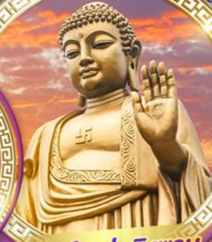
พระใหญ่หลิงซาน