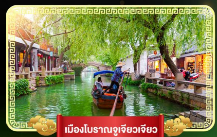
เมืองโบราณจูเจียวเจียว