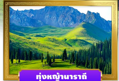
กุ่มหญ้านาราตี