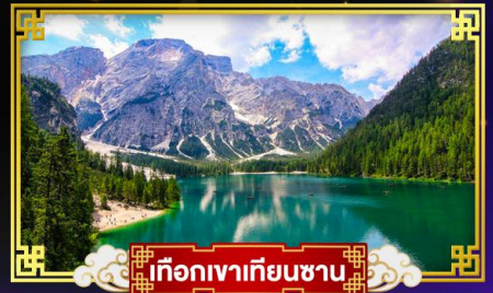
เทือกเขาเทียนชาน