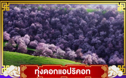
ทุ่งดอกแอปริคอต