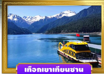
เทือกเขาเทียนชาน