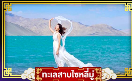
ทะเลสาบไซหลิน