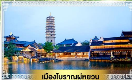
เมืองโบราณฝูหยวน