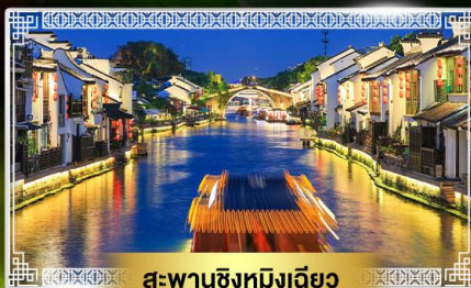
สะพานชิงหมิงเจียว