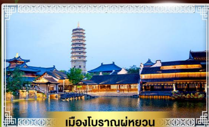
เมืองโบราณฉู่ทงหวาน

ล่องเรือทะเลสาบซีหู ไข่มุกแห่งเมืองหางโจว รักการะ "ฉิ่งซานต้าฝอ"