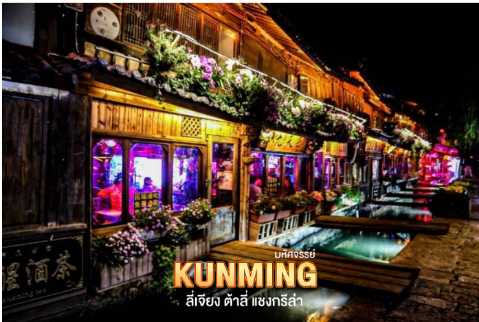
มทกธรรย KUNMING ลี่เจียง ด้าลี่ แชนกรีล่า