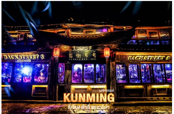
มทกธรรย KUNMING ลี่เจียง ด้าลี่ แชนกรีล่า