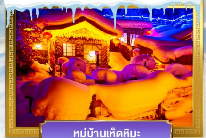
หมู่บ้านเห็ดหิมะ

เดินทางโดย : สายการบินเซินเจิ้นแอร์ไลน์ (ZH)