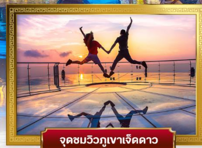
จุดชมวิวกูเขาเจ็ดดาว