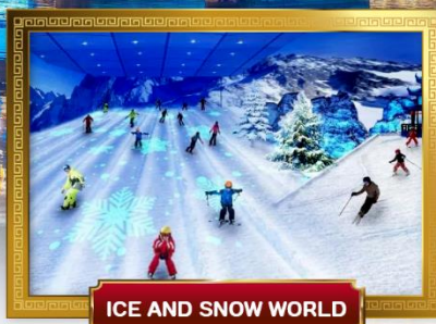
ICE AND SNOW WORLD