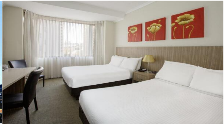
(โรงแรมย่านกลางเมือง ใกล้แหล่งช้อปปิ้ง เดินทางสะดวก) *รูปภาพเพื่อการโฆษณา*

วันที่สอง นครซิดนีย์ – อุทยานแห่งชาติบลูมาร์ทเท่นส์ – เขาสามยอด – SCENIC WORLD (นั่งรถรางไฟฟ้า + นั่งกระเช้า SCENIC CABLE WAY) – สวนสัตว์พื้นเมือง FEATHERDALE WILDLIFE PARK (ชม โด อาล่า จิงโจ้ วอมแบท