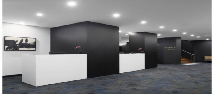
(โรงแรมย่านกลางเมือง ใกล้แหล่งช้อปปิ้ง เดินทางสะดวก) *รูปภาพเพื่อการโฆษณา*

วันที่สี่ เมลเบิร์น - Gibson Steps - 12 APOSTLES (ครึ่งสาย) - อุทยานแห่งชาติพอร์ต แคมป์เบลล์ - OPTION TOUR นั่งเฮลิคอปเตอร์ - London Bridge