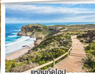
แหลมทิวโฮป