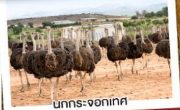
นกกระ-จอกเทศ