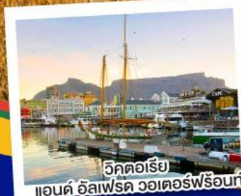
วิกตอเรีย แอนด์ อัลเฟรด วอเตอร์ฟรอนท์

เปิดประสบการณ์กับภัตตาคาร Canivore สวรรค์ของคนรักเนื้อสัตว์