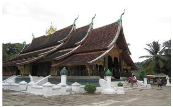
วัดเชียงทอง