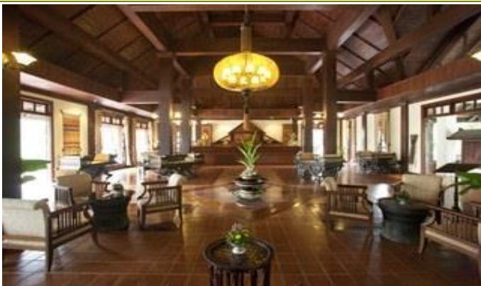
บรรยากาศในล็อบบี้ของ Santi Resort & Spa