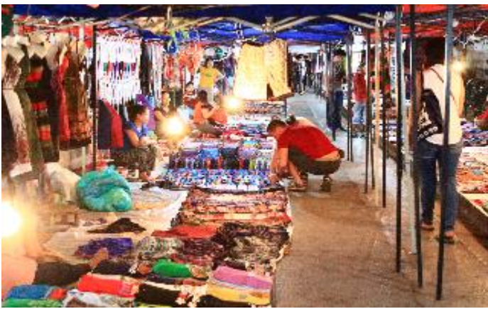
บรรยากาศตลาดกลางคืน