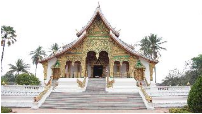
พระราชวัง และ หอพิพิธภัณฑ์หลวงพระบาง