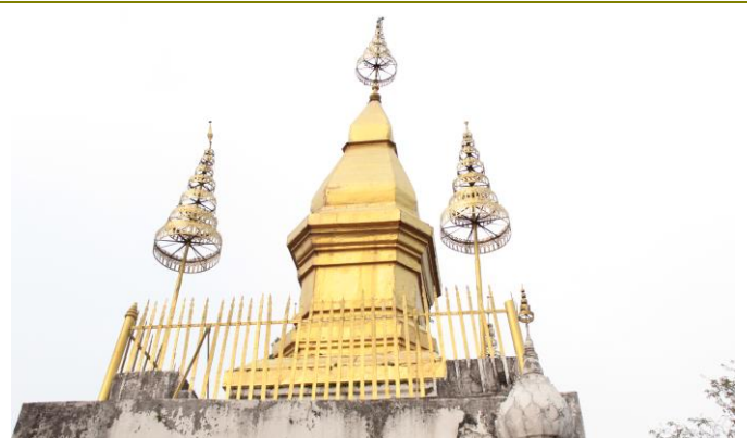
พระธาตุพูตี