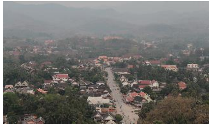
บรรยากาศภายในตัวเมืองหลวงพระบาง