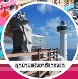
อุทยานแห่งชาติแกงแด