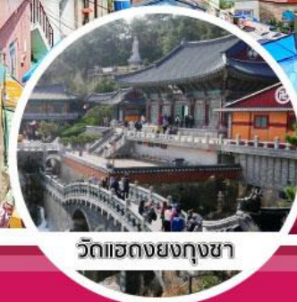
วัดแฮดงยงกุงซา