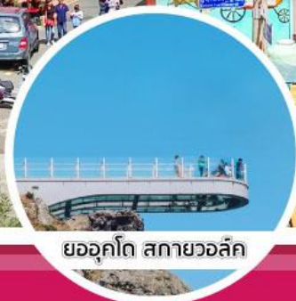
ยออดโด สกายวอล์ค