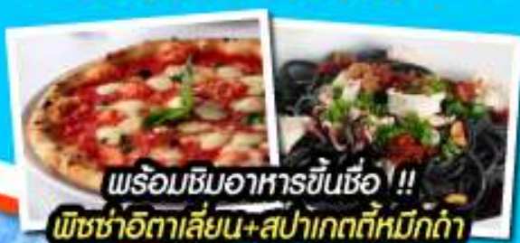
พร้อมชิมอาหารขึ้นชื่อ !! พิซซ่าอิตาลีแสน+สปาเก็ตตี้หมักดำ