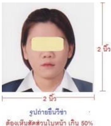
ตัวอย่างรูปถ่ายเพื่อยื่นขอวีซ่า U.S.A.

หนังสือเดินทางของท่าน จะถูกส่งคืนมาที่บ้านท่านทางไปรษณีย์ ตามที่อยู่ที่ยกรอกในแบบฟอร์มไว้